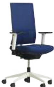
BASIC / UP